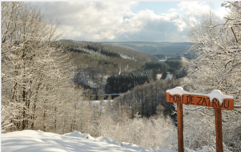
(C. Francois MTBA)