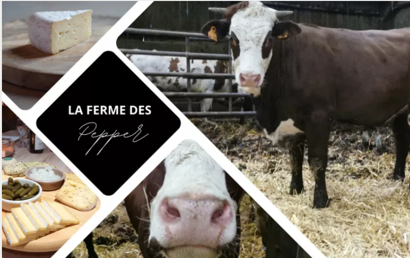
Attribution : (ferme Pepper)