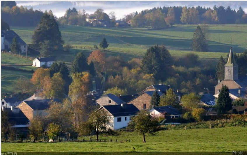
ms/FTLB Crédit : (P.Willems/FTLB)