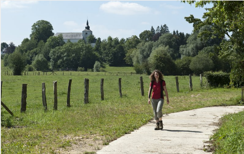
(Michel Laurent/La Lorraine Gaumaise)