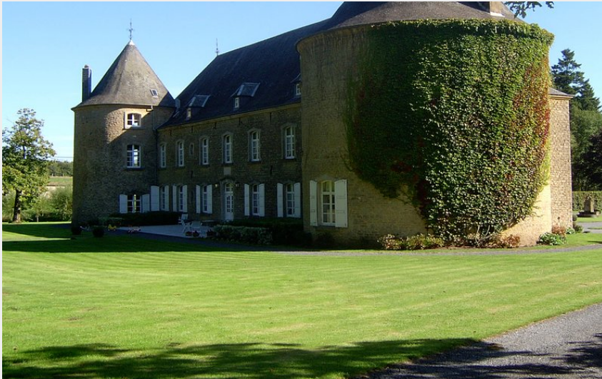
(SI de Tintigny)