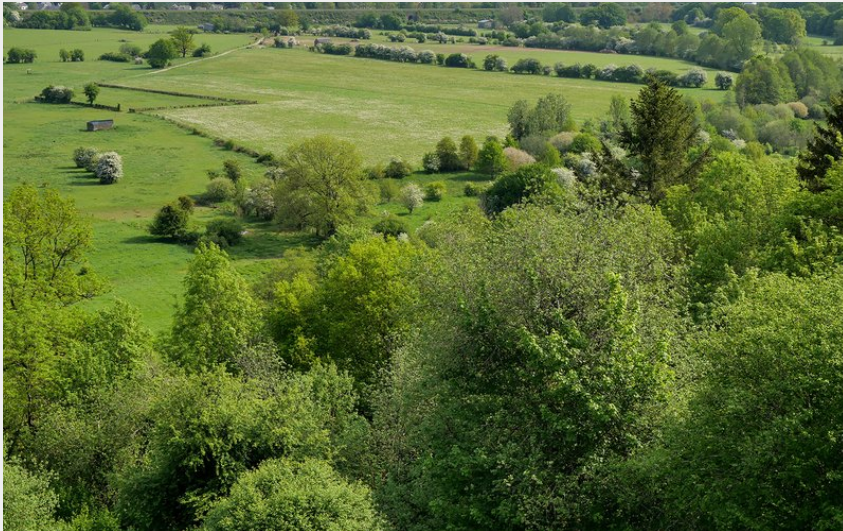
(Trekking & Voyage)