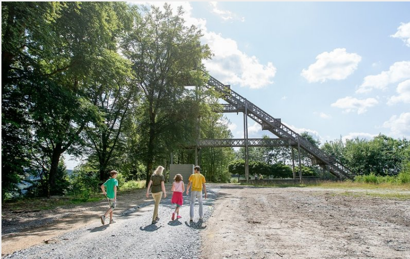
(WBT David Samyn)