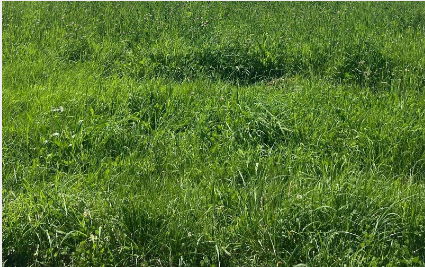
(Libre de droit)